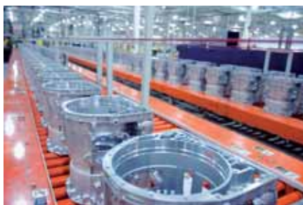
Чем выше производительность, тем ниже ССВ, например, на заводе зубчатых передач.

Вся продукция Мицубиси обладает высоким уровнем надежности. Однако если требуется техническое обслуживание, имеется несколько способов повысить производительность техников. Открытая архитектура сети CC-Link и iQ Works позволяет специалисту по обслуживанию систем искать ошибки во всей сети контроллеров iQ из одного рабочего места. Проблемы с линией быстро обнаруживаются и идентифицируются. Если придется открывать шкафы, обслуживающий персонал приступит к работам сразу же после прибытия.